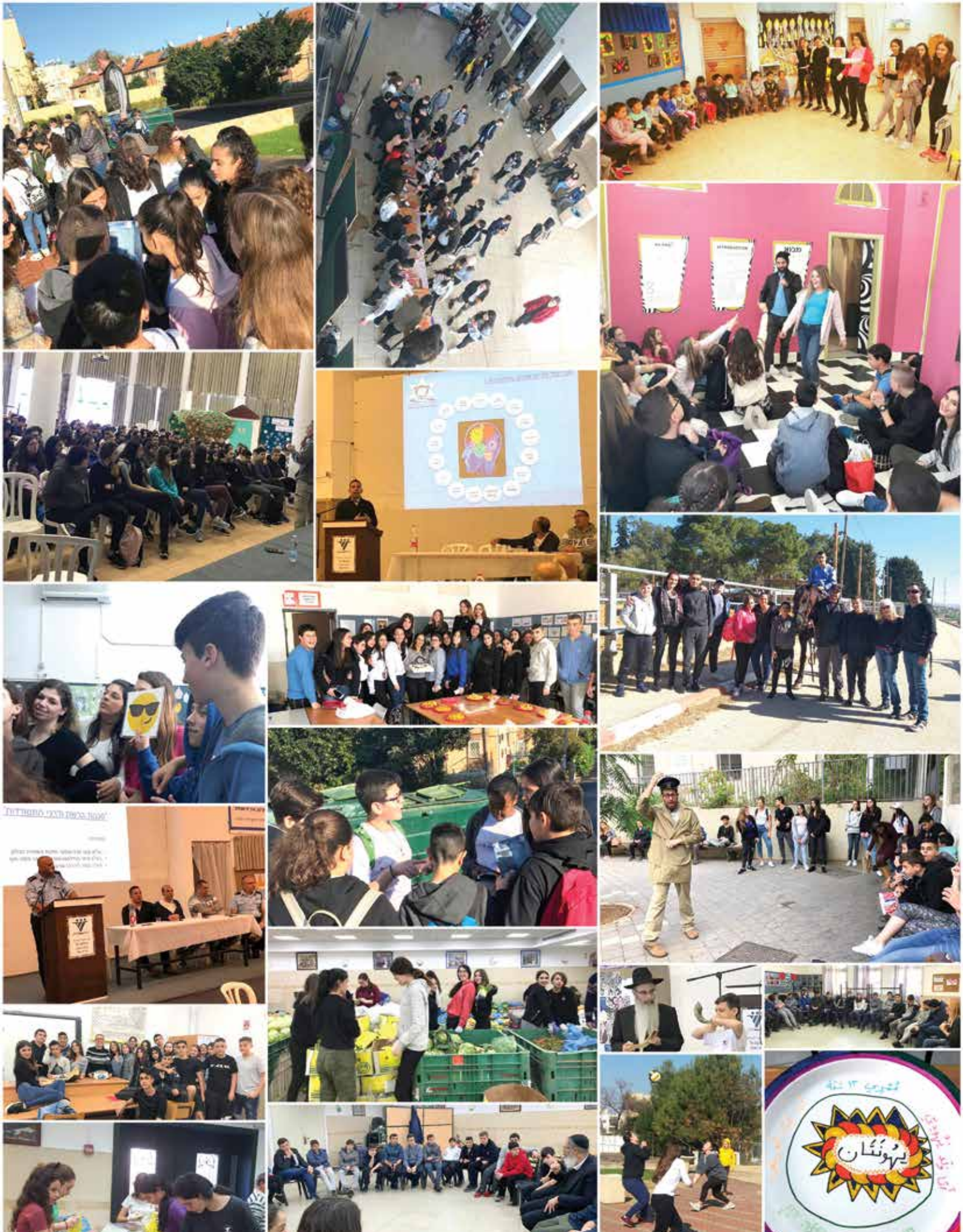
תמונות מחיי ביה"ס